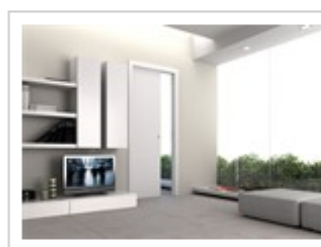
Eclisse EWOLUTO scorrevole