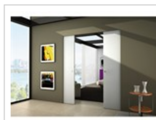
Eclisse SYNTESIS® LINE scorrevole