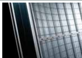
Detalhe das paredes do caixilho

Para deslizar na guia curva, os carros deslizantes bi-rodas Eclisse adaptam-se a diferentes raios de curvatura.