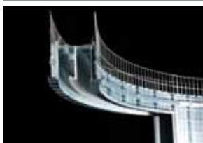
Detalhe da guia curva

Para deslizar na guia curva, os carros deslizantes bi-rodas Eclisse adaptam-se a diferentes raios de curvatura.